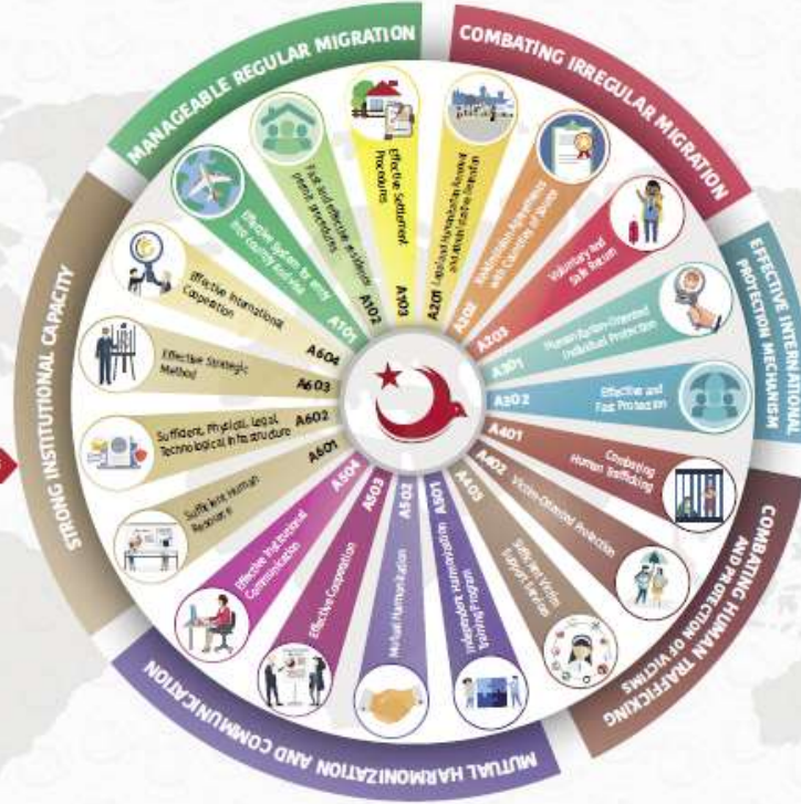
Şekil 2. Bir Bakışta GİGM 2019-2023 Stratejik Planı