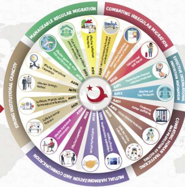
Şekil 2. Bir Bakışta GİGM 2019-2023 Stratejik Planı